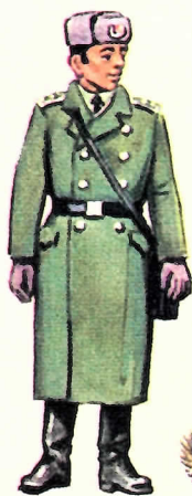
Dienstuniform im Winter