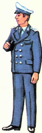
Dienstuniform der Wasserschutzpolizei